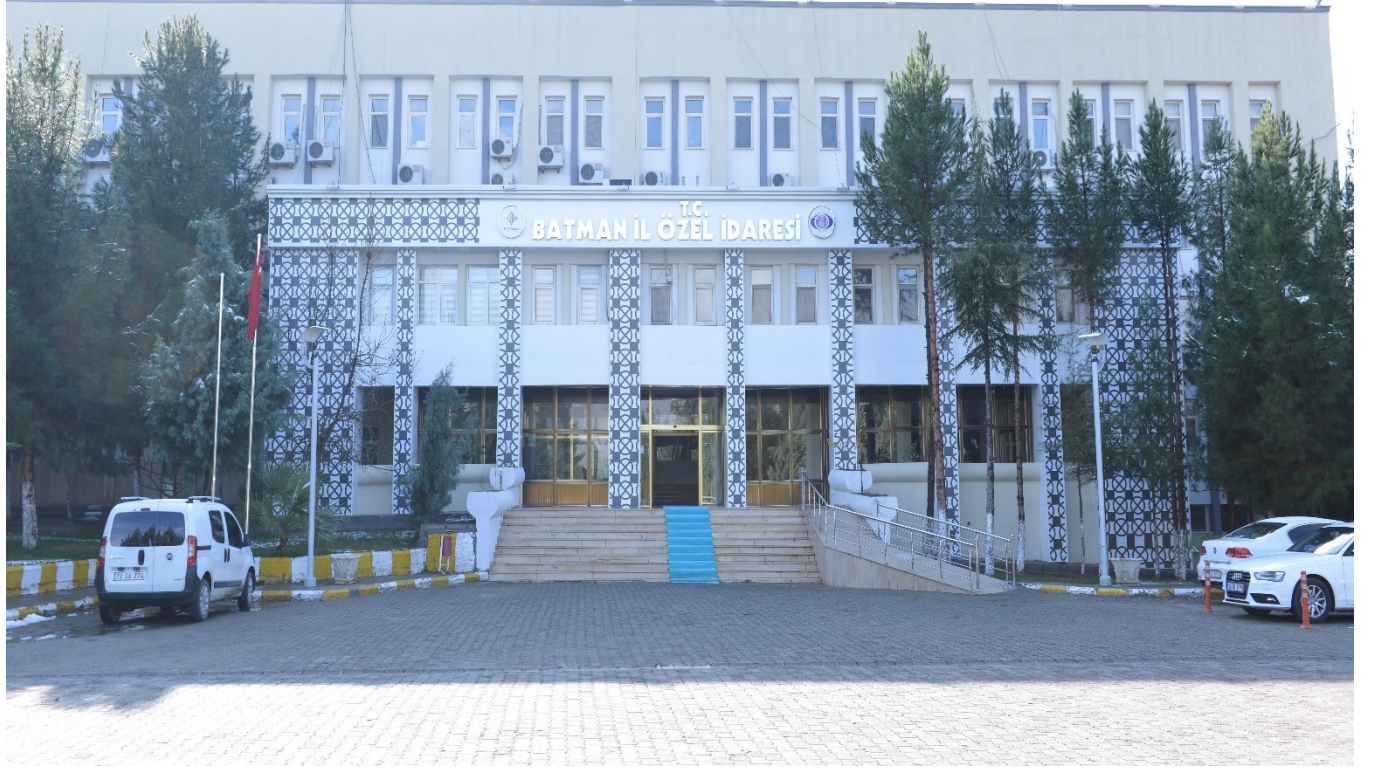
TABLO 1: İL ÖZEL İDARESİNE AİT TAŞINMAZLARIN GENEL LİSTESİ